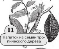
Напиток из семян тропического дерева