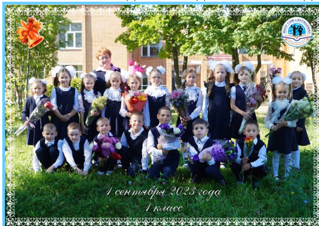
1 сентября 2023 года 1 класс

БУРМАКИНСКАЯ ГАЗЕТА ДЛЯ МОЛОДЕЖИ И О МОЛОДЕЖИ